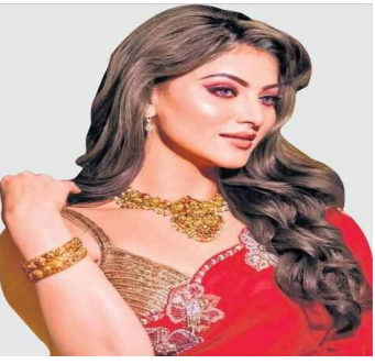
సైఫ్ సర్ నమ క్షమించు సైన్యాలో..

షష్ఠి పూర్తి గురువారం , సూర్యోదయం: 6.50, సూర్యాస్తమయం: 6.04, శ్రీ క్రోధి నామ సంవత్సరం, ఉత్తరాయణం, హేమంత ఋతువు, పుష్యమాసం, కృష్ణపక్షం, షష్ఠి పూర్తి, ఉత్తర ఫల్గుణి: సా.5.07, వర్తం: రా.2.23 4.09కు, రాహుకాలం: సా. 4.30ల 6.00కు, యమగండ కాలం: ప.12.00ల 1.30కు, దుర్ముహూర్తం: సా.4.34ల 5.19కు .