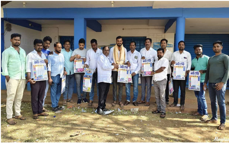
ఝరాసంగం,జనవరి 20 ( పెన్ గన్ న్యూస్ ) : సంగారెడ్డి జిల్లా

- నూతన క్యాలెండర్ ను ఆవిష్కరించి, ప్రశంసించారు