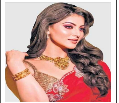
సైఫ్ సర్ నమ క్షమించు సైన్యాల్లో..

వారం వర్తం: షష్ఠి పూర్తి సోమవారం, సూర్యోదయం: 6.50, సూర్యాస్తమయం: 6.04, శ్రీ క్రోధి నామ సంవత్సరం, ఉత్తరాయణం, హేమంత ఋతువు, పుష్యమాసం, కృష్ణపక్షం, షష్ఠి పూర్తి, ఉత్తర ఫల్గుణి: సా.5.07, వర్తం: రా.2.23 4.09కు, రాహుకాలం: సా. 4.30ల 6.00కు, యమగండ కాలం: ప.12.00ల 1.30కు, దుర్ముహూర్తం: సా.4.34ల 5.19కు .