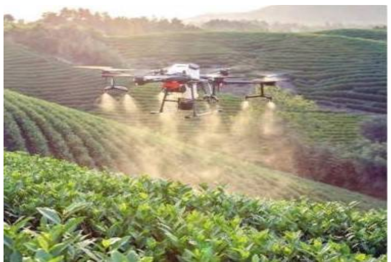
ఖమ్మర్, జనవరి 18 ( పెన్ గన్ న్యూస్ ) : యావత్ దేశంలో ప్రభుత్వ రంగ సంస్థలను కబళించిన కార్పొరేట్ సంస్థల కన్ను ఇప్పుడు వ్యవసాయ రంగంపై పడింది. సాగు భూమిని తమ ఆక్రమణలోకి తెచ్చుకోవడం ద్వారా ఈ దేశాన్ని - తరువాయి 2 లో..

ఊతమిస్తున్న మోదీ సర్కార్ కుట్టలో భాగమే నూతన ఒప్పందాలు రైతాంగ ఉద్యమాలతోనే వ్యవసాయ రంగ పరిరక్షణ