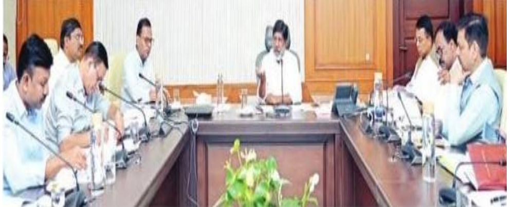
మార్కు ఆదేశించారు. అమలుకు సంబంధించి గత ఎనిమిది సంవత్సరాలుగా క్షేత్రస్థాయిలో వివిధ శాఖల్లో అధ్యయనం చేసిన సెస్ నివేదికను సమావేశంలో సంబంధిత అధికారులు ప్రదర్శించారు. సెస్ అధికారులు పరిశీలించిన అంశాలు, ఆ అంశాల విషయాల్లో అధికారులు సాధించిన ఫలితాలను డిప్యూటీ సీఎం ఆరా తీశారు. నివేదికలను పైనాన్స్, ప్లానింగ్ శాఖ అధికారులకు అందజేసి వారితో తరచూ సమావేశం కావాలని సెస్ అధికారులను ఆదేశించారు. అటవీ భూముల్లో సోలార్ పవర్ ద్వారా - తరువాయి 2 లో..

హైదరాబాద్, జనవరి 18 ( పెన్ గన్ న్యూస్ ) : ప్రతి శాఖలో ఎస్సీ, ఎస్సీ సబ్ ప్లాన్ చట్టం ప్రకారం నిధులు సకాలంలో ఖర్చు చేయాలని తెలంగాణ ఉప ముఖ్యమంత్రి మల్లు భట్టి విక్రమార్కు అన్నారు. సబ్ ప్లాన్ చట్టం ప్రకారం అందుబాటులో ఉన్న నిధులను సంపూర్ణ స్థాయిలో వినియోగించాలని, చేస్తున్న వ్యయం వివిధ వర్గాల్లో ఆదాయం బాగా పెరిగితే, ఆస్తులు మరింత సమర్థవంతంగా నిర్వహించేలా అధికారులు ప్రణాళికలు రూపొందించాలని డిప్యూటీ సీఎం అధికారులను ఆదేశించారు. వీటికి సంబంధించిన పూర్తి వివరాలతో ఈనెల 23న నిర్వహించనున్న సమావేశానికి రావాలని అధికారులను కోరారు. డాక్టర్ బి.ఆర్.అంజేద్గర్ సచివాలయంలో శుక్రవారం ఎస్సీ, ఎస్సీ సబ్ ప్లాన్ చట్టం అమలు తీరుపై వివిధ శాఖల ఉన్నతాధికారులతో డిప్యూటీ సీఎం సమీక్ష సమావేశం నిర్వహించారు. సబ్ ప్లాన్ చట్టం ప్రకారం శాఖల వారీగా చేసిన ఖర్చు వివరాలను ప్రతి నెలరోజులకు ఒక సారి వెల్లడించాలని అధికారులను ఆయన ఆదేశించారు. సబ్ ప్లాన్ చట్టం కోటా ప్రకారం ఇప్పటివరకు నిధులు ఖర్చు చేయని శాఖల అధికారులు రానున్న రెండు నెలల్లో లక్ష్యాన్ని చేరుకునేందుకు ఎటువంటి ప్రణాళికలు సిద్ధం చేసుకున్నారని వివిధ శాఖల అధికారులను డిప్యూటీ సీఎం ప్రశ్నించారు. బడ్జెట్ యేతర నిధులు ఖర్చు చేసే సమయంలోనూ ఎస్సీ, ఎస్సీ సబ్ ప్లాన్ చట్టం ప్రకారం జనాభా దామాషాలో నిధుల ఖర్చు జరిగిందా? లేదా? అందుకు సంబంధించిన సంపూర్ణ సమాచారం అందించాలని అధికారులను డిప్యూటీ సీఎం భట్టి విక్ర