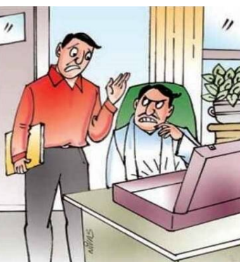
కాంట్రాక్టర్ కదా అని పనిచేసి పెట్టా... సూట్స్ ఇచ్చిపోతే అమ్మమ్మ అనుకున్నా.. వాడికి సూట్స్ కంపెనీకూడా ఉందని తెలియదా!